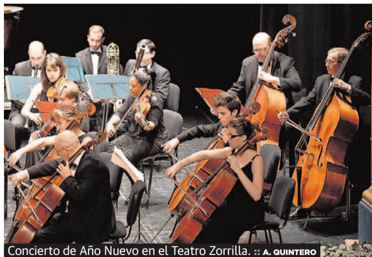
Concierto de Año Nuevo en el Teatro Zorrilla.