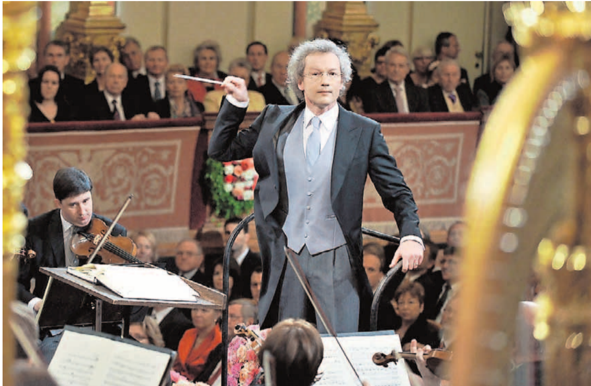
El maestro austríaco Franz Welser-Möst, dirige a la Filarmónica de Viena.